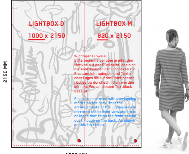
M.96.0820.2150 BB BB=Rückseite Blockout bedruckt mit Öse BB=Backside Blockout printed with eyelet

SICHTMASS GESAMT + 20MM DRUCKERWEITERUNG UMLAUFEND + DATEIGRÖSSE 1860 x 2500 TOTAL VISIBLE SIZE + 20 MM SURROUNDING PRINT EXTENSION = PRINT SIZE 1860 X 2500