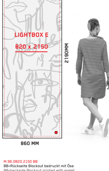
M.96.0820.2150 BB BB=Rückseite Blockout bedruckt mit Öse BB=Backside Blockout printed with eyelet

SICHTMASS + 20MM DRUCKERWEITERUNG UMLAUFEND - DATEIGRÖSSE 860 x 2500 TOTAL VISIBLE SIZE + 20 MM SURROUNDING PRINT EXTENSION = PRINT SIZE 860 X 2500