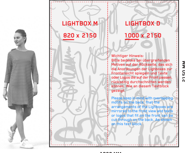
M.96.0820.2150 LB LB=Textil Durchlicht bedruckt LB=Textile backlit printed