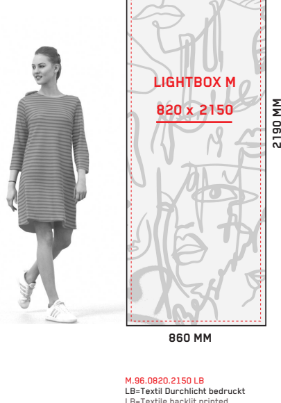
M.96.0820.2150 LB LB=Textil Durchlicht bedruckt LB=Textile backlit printed