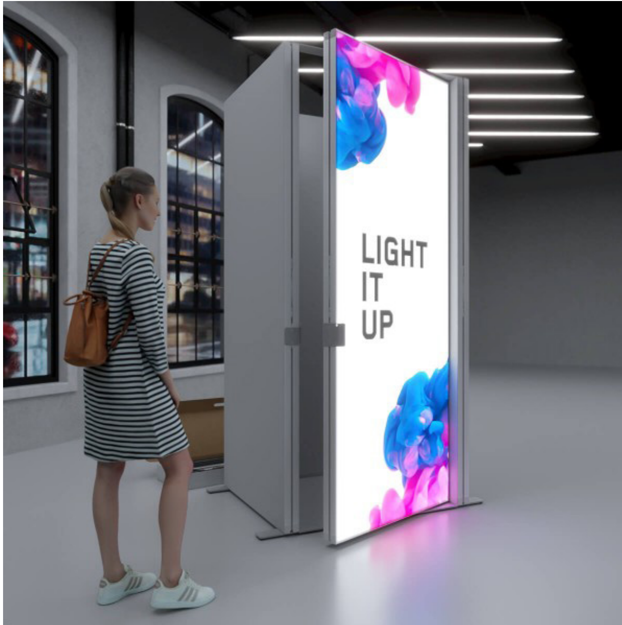
LED Messewand - Reihe LED Exhibition Wall - Series